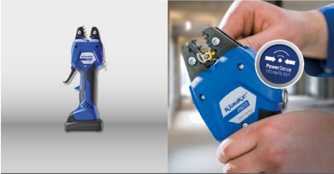
CRIMPZANGE KLAUKE MICRO