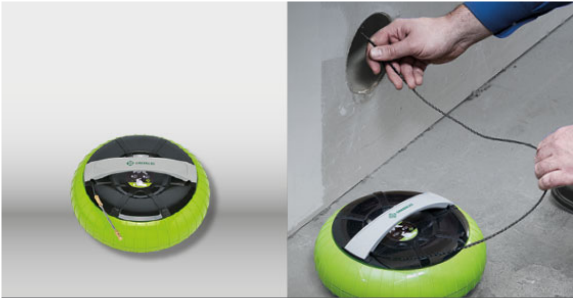
KABELEINZIEHSYSTEM DURA SPINNER