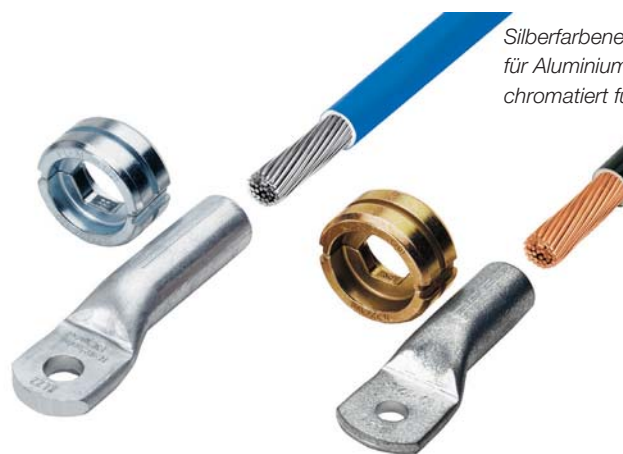
Silberfarbene Einsätze für Aluminium, gelb chromatiert für Kupfer.