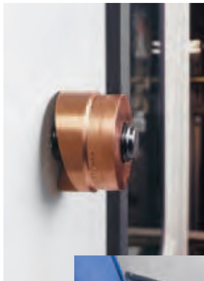
Einfach Matrize ansetzen und stanzen.

Die Standard-Werkzeuge sowie die der Serie Slug Buster® eignen sich zum Stanzen von Stahl, Aluminium und Kunststoff. Die Serie Slug Splitter® ist speziell geeignet für V2A-Bleche.